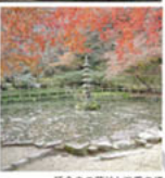
延命寺の湧池と五葉の塔