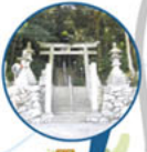
高野街道(三日市付近)