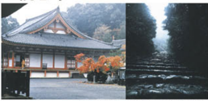
観心寺金堂(国宝) 観心寺から後村上天皇権屋跡へ続く石段