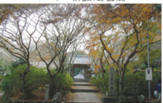
延命寺はもみぢの名所としても名高く特に開創1000年と伝えられるカエデの巨木は必見です!