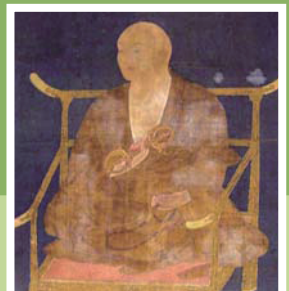
弘法大師像 / 小深自治会蔵

「弘法大師」ゆかりのコースⅡ 千二百年前に弘法大師が残した威光は今も輝き 全国から参拝者が絶えることのない高野山 かつてその霊峰に向かった道を歩いてみませんか