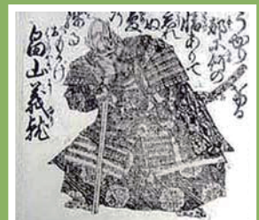
畠山義就像

かつて戦乱の舞台となった烏帽子形城 今は木々が茂り、時には鳥獣が迎えてくれる 自然豊かな城跡を散策してみませんか