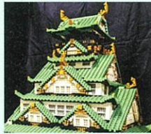
※こちらは阪大レゴ部の展示作品です

阪大レゴ部によるワークショップ! 手のひらサイズのお城を ブロックで組み立てよう!!