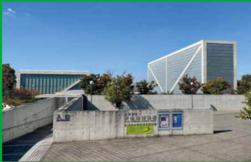
大阪府立狭山池博物館