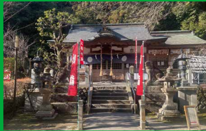
三都神社(熊野神社)