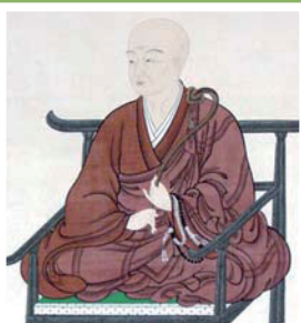
浄厳和尚絵像 / 延命寺蔵

将軍や大名をはじめ、民衆からも尊敬された浄厳 その高僧を生んだ地に赴き、延命寺を訪ねて 新しい年を清々しい気持ちで始めませんか